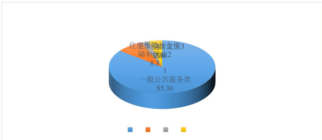
图 3：财政拨款支出决算结构（按功能分类）

2020 年度财政拨款支出 39.89 万元，主要用于以下方面：一般公共服务（类）支出 34.05 万元，占 85.36%；公共安全类（类）支出 0 万元，占 0%；教育（类）支出 0 万元，占 0%；科学技术（类）支出 0 万元，占 0%；社会保障和就业（类）支出 3.31 万元，占 8.30%；卫生健康支出 0.95 万元，占 2.38%，住房保障（类）支出 1.58 万元，占 3.96%。